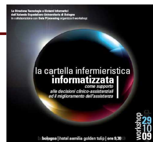
Workshop Cartella Informatizzata