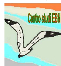
Logo Centro Studi EBN

Abstract delle Revisioni Cochrane (SUPSI Svizzera italiana)